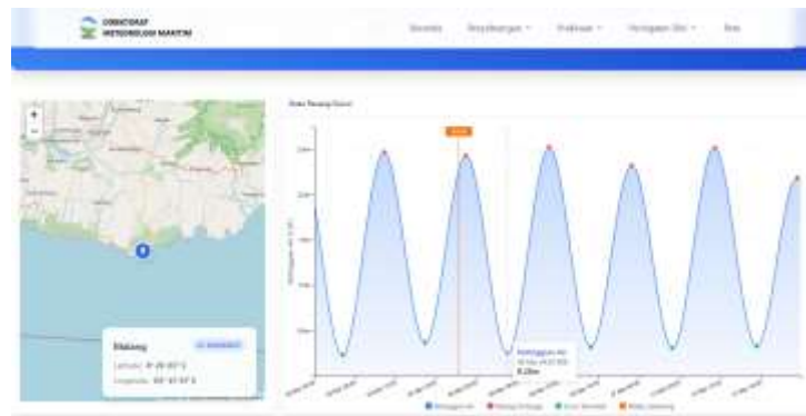
Gambar 1. Grafik Pasang Surut Air Laut di Lokasi Penelitian

Penelitian dilaksanakan di zona intertidal Pantai Ngentup, Malang Selatan, Jawa Timur, pada tanggal 6 November 2025. Transek pengamatan ditarik tegak lurus dari garis pantai menuju arah laut hingga mencapai batas surut terendah yang masih dapat diakses secara aman. Dengan demikian, transek mencakup gradien zona intertidal dari bagian atas hingga mendekati zona bawah tanpa pemisahan kategoris sub-zona (atas, tengah, bawah), namun tetap merepresentasikan variasi kondisi mikrohabitat sepanjang gradien pasang surut. Titik koordinat lokasi dicatat menggunakan aplikasi Alpine Quest berbasis GPS Android untuk memastikan ketepatan spasial penelitian.