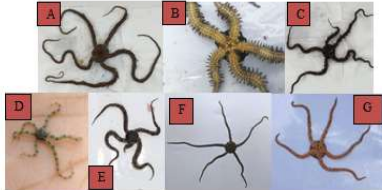
Gambar 3. Beberapa temuan Echinodermata kelas Ophiuroidea di Pantai Ngentup (A) Ophiocoma scolopendrina (B) Ophiomastix annulosa (C) Clarkcoma canaliculate (D) Ophiarachna incrassata (E) Ophiocomina nigra (F) Ophiolepis superba (G) Ophioplocus imbricatus

substrat pasir dan memiliki kemampuan membenamkan diri, sehingga bentuk tubuh pipih menjadi ciri adaptif terhadap lingkungan tersebut.